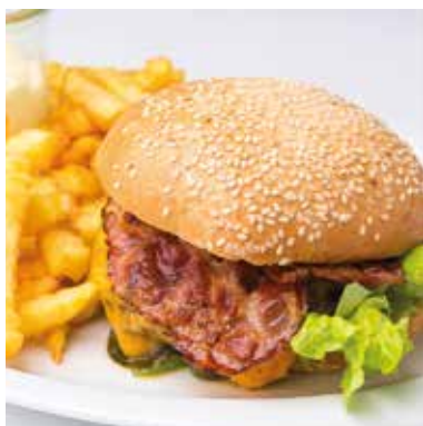
27. Sept. bis 13. Okt. 2021 Burgerwochen