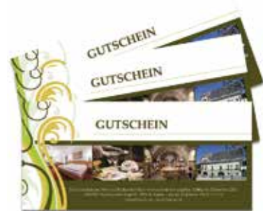
Gutscheine zum Verschenken

Für Ihren Besuch gelten die Covid- Maßnahmen