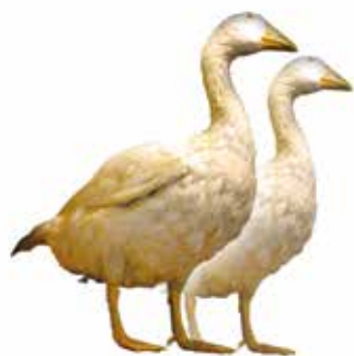
08. bis 14. November 2021 Martini Gansl