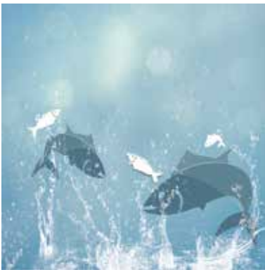
07. bis 13. März 2022 Fisch & Vegan