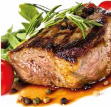
17. bis 30. Jänner 2022 Steaks