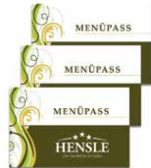
Menüpass Wir belohnen Ihre Treue!