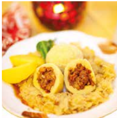
14. bis 20. Februar 2022 Knödelwoche